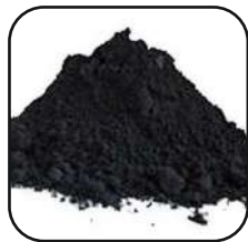
الكربون الأسود الكربوني

يُعرف أيضًا باسم زيت الإطارات، أو زيت الانحلال الحراري أو زيت التدفئة أو زيت التدفئة أو زيت القرن. الاستخدام الاستخدام هو وقود التدفئة ل صناعات مثل محطة توليد الكهرباء ومصنع الأسمنت، ومصنع الصلب ومصنع المعادن ومصنع الزجاج وما إلى ذلك.